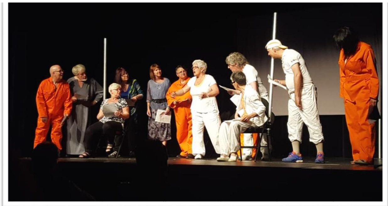
« Je suis le Théâtre Aphasique » - La troupe de comédiens du Théâtre Aphasique

30 000 spectateurs ont assisté à l'une ou l'autre de ces représentations.