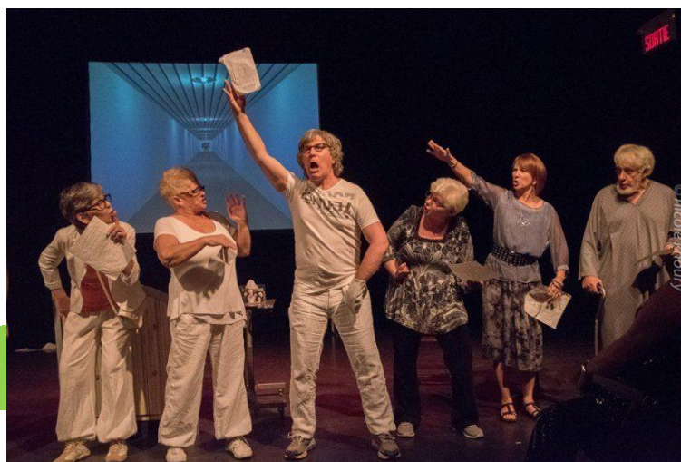
Comédiens du Théâtre Aphasique

Finalement, les associations et organismes communautaires prennent la relève et offrent aux personnes aphasiques différentes activités favorisant la poursuite de leur travail de réadaptation et surtout de leur réinsertion sociale.